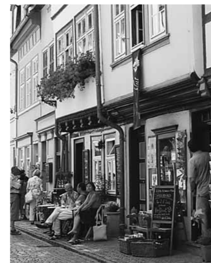
Impressionen vom der Erfurter Krämerbrücke