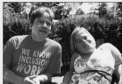
Während der Tagung wurden viele Gespräche geführt